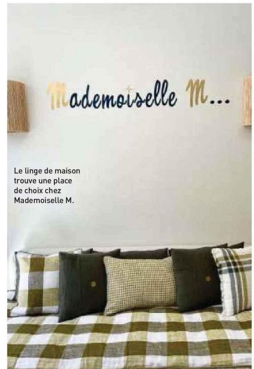
Le linge de maison trouve une place de choix chez Mademoiselle M.

MADemoiselle M, 21, AVENUE SAINT-EXUPÉRY, 31400 TOULOUSE. MELLE-M.COM SUR INSTAGRAM : @HELLOMADemoiselleM