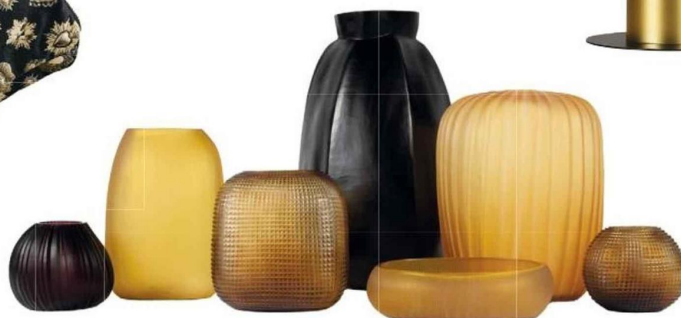
Collection de vases en verre Earthline. GUAXS ► Aubry Décoration , Lamballe