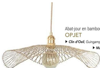
Abat-jour en bambou pour suspension Libellule XXL.

► Literie Confort , Languueux, Lamballe, St-Agathon, St-Quay-Perros, Paimpol