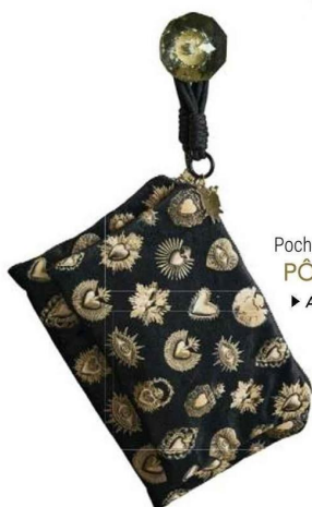
Pochette en velours ex-voto St-Emilion XS.