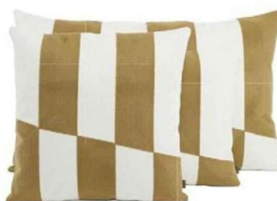
Housse de coussin Sidney en coton brodé.

► Clin d'Oeil , Guingamp ► Maison et Caprices , Lamballe ► Maison Jes , St-Alban