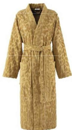
Peignoir/kimono Fauve Vittorio, en jacquard velours ciselé.