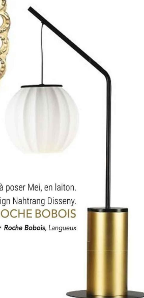
Lampe à poser Mei, en laiton. Design Nahtrang Disseny.

► Agape , Loudéac, Pontivy ► Clin d'Oeil , Guingamp