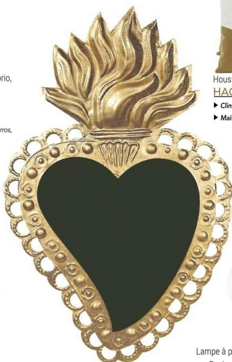
Miroir ex-voto Eligia, fer blanc patiné à la main.

► Clin d'Oeil , Guingamp ► Maison et Caprices , Lamballe