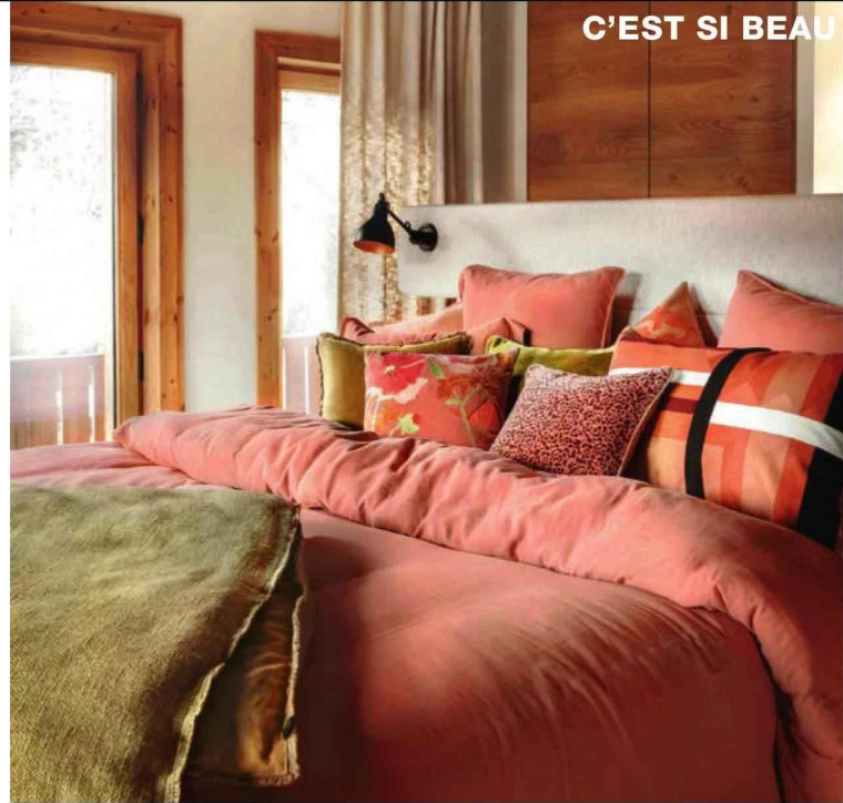
C'EST SI BEAU

Vos conseils à l'achat ? Privilégier la fabrication française, gage de qualité. Pister les labels comme Oeko-Tex (absence de substances nocives), NF Environnement ou Origine France Garantie. Fuir les matelas enroulés qui viennent de Chine, intraquables. Se demander quel type de confort on aime (ferme, enveloppant...) et opter si possible pour une largeur de 160 cm, voire 180 cm.