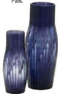
Hypnotiques Vases « Purple Rain », en verre soufflé à la bouche, Ø 15,5 x H 40 cm, 381 € les 2, et Ø 22 x H 55 cm, 381 € l'un, design Marie-Aurore Stiker-Métral, Cinna.