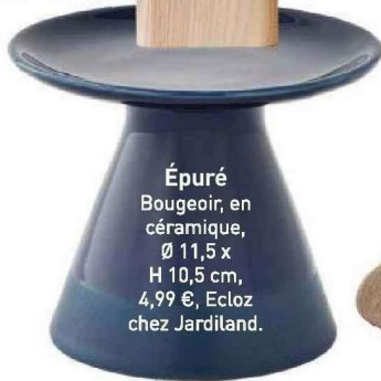
Épuré Bougeoir, en céramique, Ø 11,5 x H 10,5 cm, 4,99 €, Ecloz chez Jardiland.