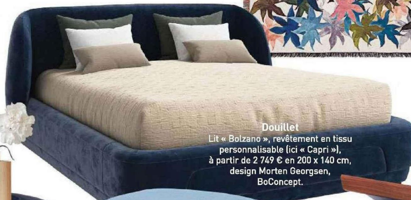
Douillet Lit « Bolzano », revêtement en tissu personnalisable (ici « Capri »), à partir de 2 749 € en 200 x 140 cm, design Morten Georgsen, BoConcept.