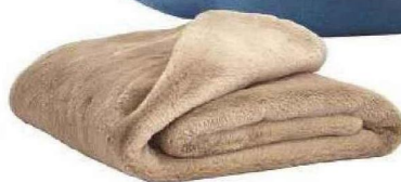
Cosy Couvre-lit « Chamonix », en polyester, doublure en suédine, à partir de 69 € en 200 x 150 cm, Haomy.