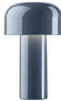
Portable Lampe « Bellhop », en plastique, rechargeable, Ø 12,5 x H 21 cm, 255 €, design Barber & Osgerby, Flos.