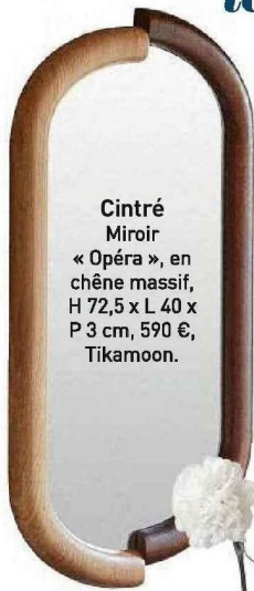
Cintré Miroir « Opéra », en chêne massif, H 72,5 x L 40 x P 3 cm, 590 €, Tikamoon.