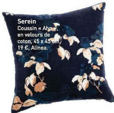
Serein Coussin « Aha », en velours de coton, 45 x 45 cm, 19 €, Alinea.