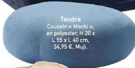
Tendre Coussin « Mochi », en polyester, H 20 x L 55 x l. 40 cm, 34,95 €, Muji.