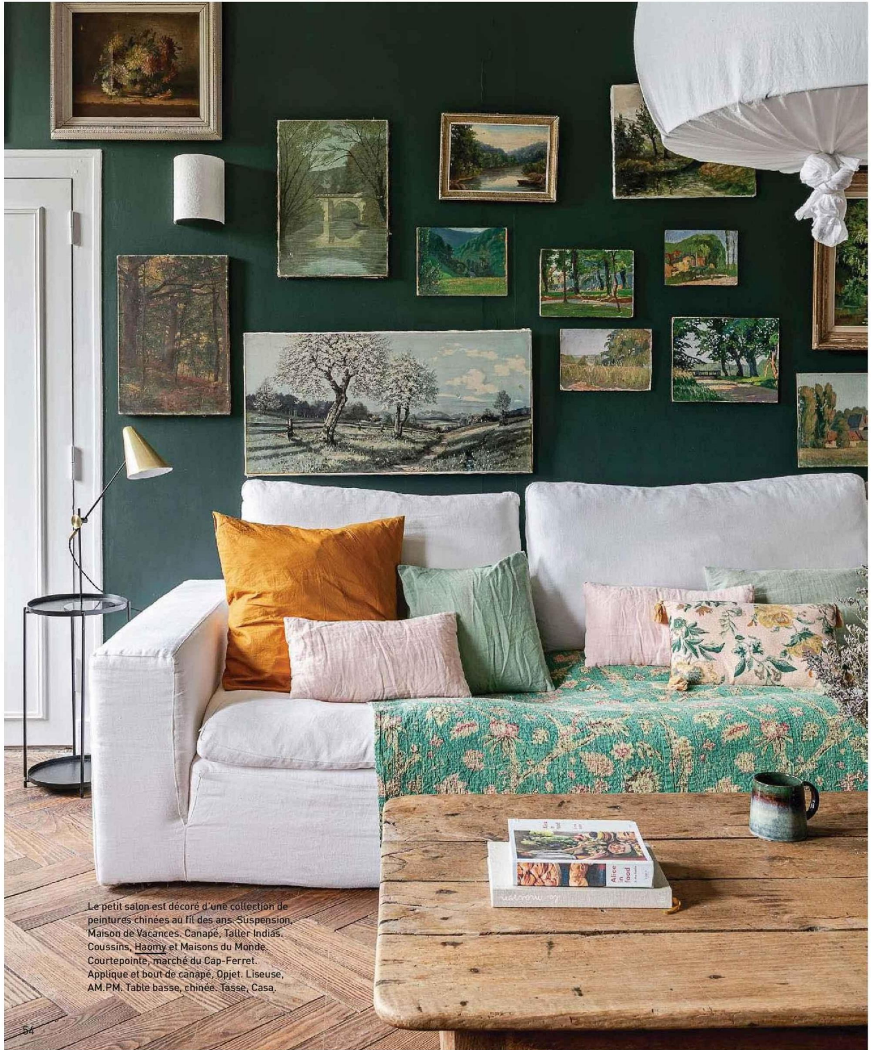
Le petit salon est décoré d'une collection de peintures chinées au fil des ans. Suspension, 'Maison de Vacances', Canapé, 'Taller Indias', Coussins, 'Haomy' et 'Maisons du Monde', Courtepointe, 'marché du Cap-Ferret', Applique et bout de canapé, 'Opjet', 'Liseuse', 'AM.PM.', Table basse, chinée, 'Tasse', 'Casa'.