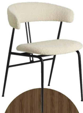
CHAISE « Violin » avec structure en acier finition époxy, assise et dossier en tissu, L. 58 x P. 55 x H. 75 cm, design GamFratesi, Gubi chez Silvera , 1299 €.