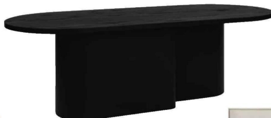
TABLE BASSE « Looi » avec base en acier et plateau en panneaux de particules plaqué chêne, L. 115 x P. 50 x H. 37 cm, noo.ma , 599 €.