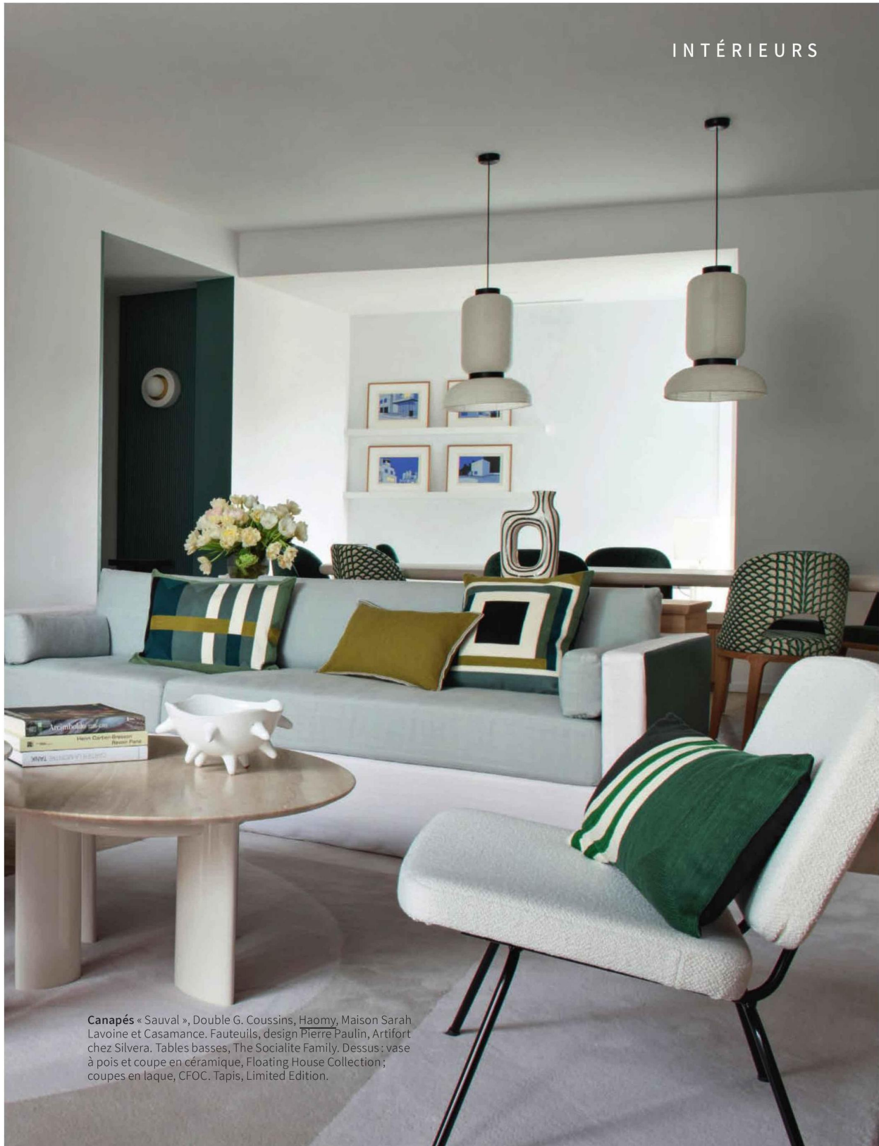
Canapés « Sauval », Double G. Coussins, Haomy, Maison Sarah Lavoine et Casamance. Fauteuils, design Pierre Paulin, Artifort chez Silvera. Tables basses, The Socialite Family. Dessus : vase à pois et coupe en céramique, Floating House Collection; coupes en laque, CFOC. Tapis, Limited Edition.