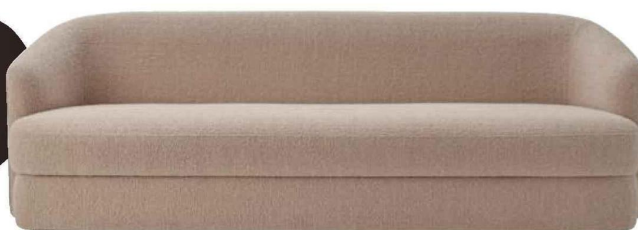
CANAPÉ 3 places « Covent Deep » avec revêtement en tissu, L. 220 x P. 82 x H. 73 cm, design Arde, New Works , 5549 €.