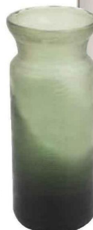
VASE « Aloha » en verre, diam. 15 x H. 35 cm, Flamant , 175 €.