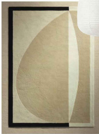
TAPIS « Abstrait » en laine et coton, 240 x 170 cm, Maison Sarah Lavoine, 1.150 €.