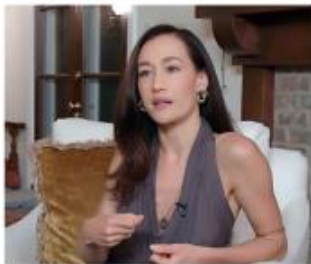
Hollywood Actress Tells All: "I Hope My Story Will Help Other Women" As featured in