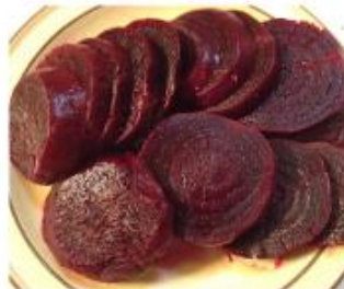
3 Foods To Avoid in 2017 880 X4 Supplement