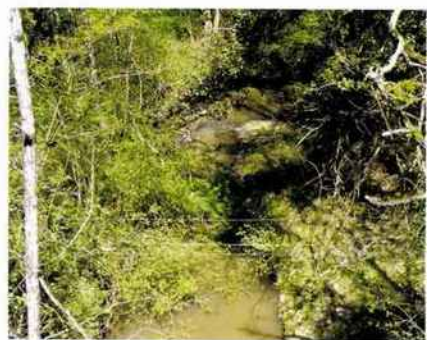
Le ruisseau La Petite Duché serpente dans les sous-bois de la forêt de la Double.

SITUÉE ENTRE GIRONDE, DORDOGNE ET CHARENTE-MARITIME, LA PETITE COMMUNE D'EYGURANDE-ET-GARDEDEUIL OFFRE DE NOMBREUX ATTRAITS TOURISTIQUES. L'ART DE VIVRE ICI SE DÉGUSTE EN VERSIONS NATURELLE ET CULTURELLE.