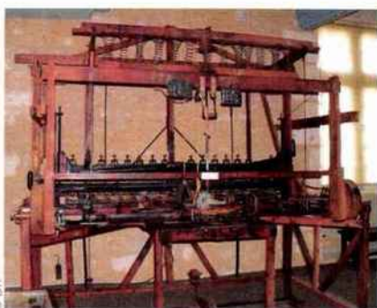
Le musée du Tabac, l'un des nombreux sites à visiter à Bergerac. Ici, une machine rare qui servait à fabriquer des pipes.

Maison des Vins de Bergerac, demeure du XVII e siècle et bâtie autour d'un beau cloître, vous initie à la dégustation des treize appellations qui composent ce vignoble. Les marchés, quant à eux, retiendront l'attention et les papilles des gourmands ! Au programme : foie gras, truffe, volaille fermière, noix, châtaignes, melons, fraises... La cité compte de nombreuses spécialités culinaires. Son musée du Tabac retrace quant à lui 3 000 ans d'histoire de la plante.