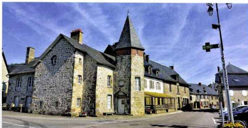
Le village, typique de la région est le résultat de la fusion de deux communes à la fin du XIX e siècle.

C ette petite commune est traversée par la Duché et son affluent la Petite-Duché. Construite au XII e puis réédifiée au XV e , sa chapelle Saint-Léonard est de style néo-roman. Le pignon de son clocher-mur abrite une reproduction de la Madone de Paris. L'église de Gardedeuil, plus récente, domine fièrement le bourg. Le village constitue un point de départ idéal pour découvrir