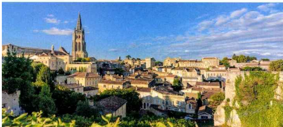
Saint-Émilion se trouve à moins de 40 kilomètres du village d'Eygurande.