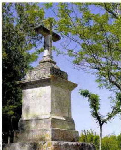
Dans les environs, divers témoignages du passé du village.