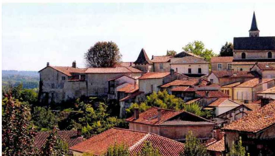
Aubeterre-sur-Dronne, à 40 kilomètres d'Eygurande-et-Gardedeuil, mérite le détour.