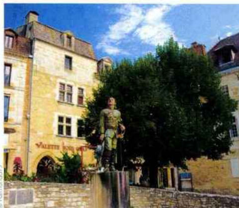
Sur la place Pélissière à Bergerac, la statue de Cyrano.

Maison des Vins de Bergerac, demeure du XVII e siècle et bâtie autour d'un beau cloître, vous initie à la dégustation des treize appellations qui composent ce vignoble. Les marchés, quant à eux, retiendront l'attention et les papilles des gourmands ! Au programme : foie gras, truffe, volaille fermière, noix, châtaignes, melons, fraises... La cité compte de nombreuses spécialités culinaires. Son musée du Tabac retrace quant à lui 3 000 ans d'histoire de la plante.