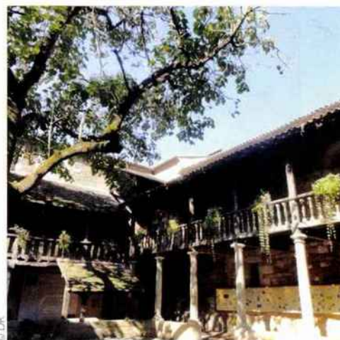
Le cloître des Récollets, à la Maison des Vins de Bergerac.