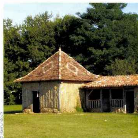
Les maisons doubleaudes sont caractéristiques, construites sans pierres, avec du bois et du torchis. Celle-ci a été réalisée à l'identique par un artisan spécialisé dans ce type de construction sur le modèle des maisons traditionnelles.