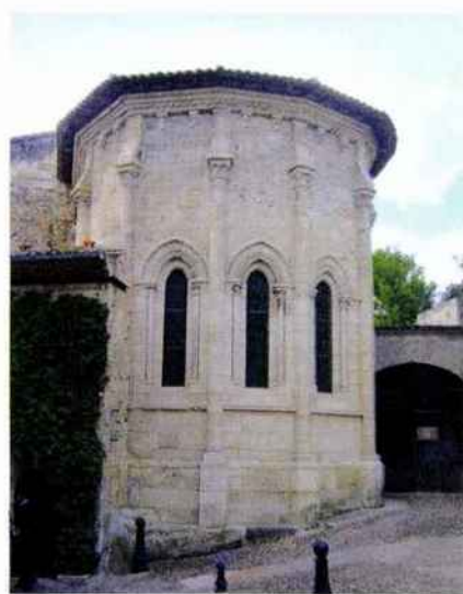
La Chapelle de la Trinité, construite au-dessus d'une grotte où aurait vécu saint Emilian au VIII e siècle.