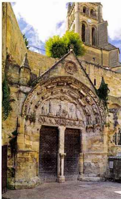
L'Église monolithe de Saint-Émilion du XI e siècle est connue pour être la seconde église monolithe au monde.

Labellisée Ville d'Art et d'Histoire, Bergerac s'étend sur les rives de la Dordogne. Sa place Pélissière est connue pour accueillir la statue de Cyrano. La