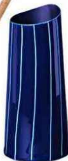
Bleu nuit Vase en émail, H 22,5 cm. Arkin, Broste Copenhagen, 53,50 €.