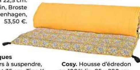
Cosy. Housse d'édredon en 100% lin, 85 x 200 cm. Waki, Harmony, 84,75 €.