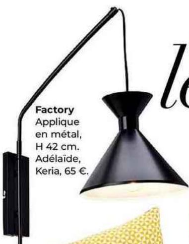
Factory Applique en métal, H 42 cm. Adélaïde, Keria, 65 €.