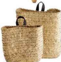
Pratiques Paniers à suspendre, H 23 et 35 cm. Tine K Home, 56 € les deux.