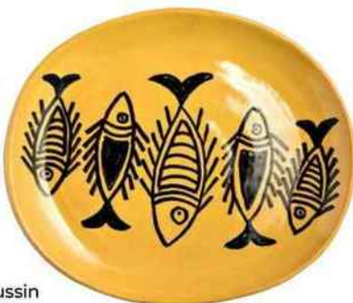
Bonne pêche Plat en terre cuite, Ø 32 cm. AM.PM, 49 €.