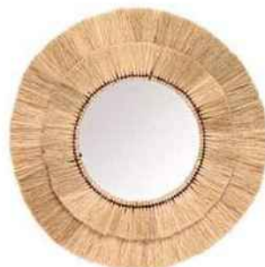
Naturel Miroir en fibre végétale, Ø 59 cm. Korolla, Caravane, 80 €.