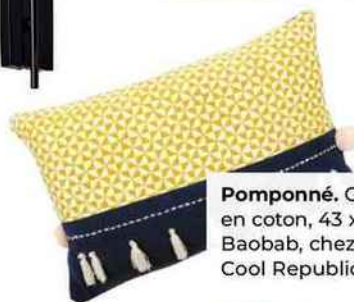
Pomponné. Coussin en coton, 43 x 28 cm. Baobab, chez The Cool Republic, 39 €.